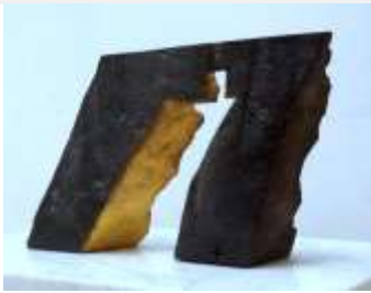
BALÁS ESZTER – ARANY KAPU III. bronz, aranyozás, márvány 19x40x20 cm.