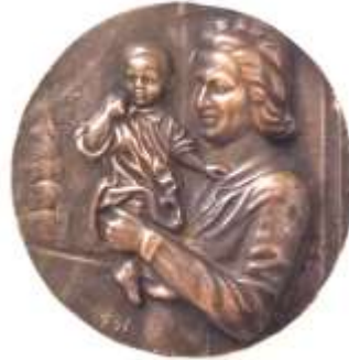
BENEDEK JÓZSEF – REKVIEM bronz 30x30 cm.