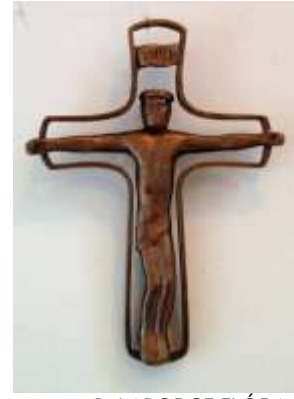
B. LABORCZ FLÓRA – FESZÜLET bronz, 23x17x2 cm.