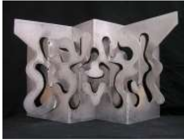
BENEDEK JÓZSEF - KOMPLEMENTER KAPCSOLATOK III. alumínium 50x75x27 cm.