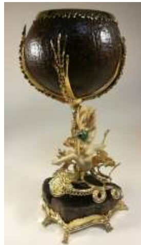
KOBURGER ZSOLT- ÉLET KELYHE II. és részlete, arany, fa, malachit, 26x13x10 cm.