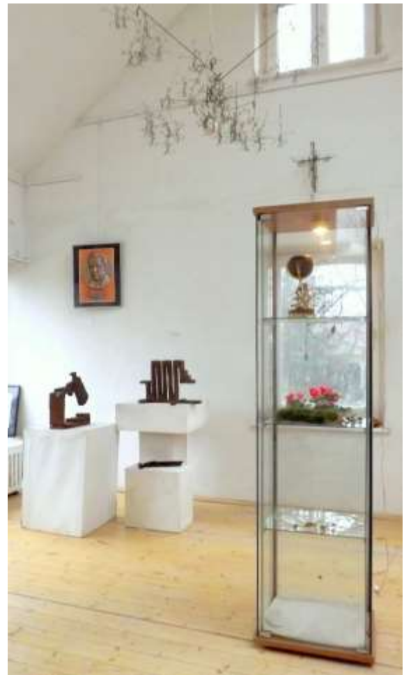
A kiállítás részlete