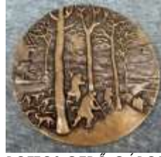
BOTTOS GERŐ GÁBOR – P.BRUEGEL bronz 11x11 cm.