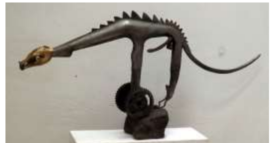
BABOS LÁSZLÓ MIKLÓS – FALLOSZAURUSZ hegesztett krómáccél, sárgaréz, 46x98x17 cm.

B.L.Terem címe: Budapest XVII. Rákoshegy, Bél Mátyás u. 41. tel: +361 258 2583, mob.: +36 70 575 0994 e-mail: flora.b.laborcz@gmail.com www.benedeklaborcz.hu