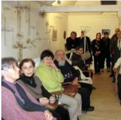
Képek a megnyitóról