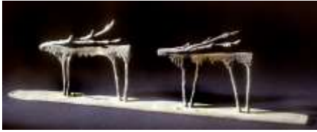
BAKOS ILDIKÓ – KÉT SZARVAS bronz 12x48x5,6 cm.