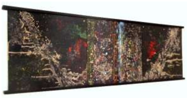
SOR JÚLIA – UNIVERZUM zománczott acéllemez, fakeret 30x100 cm. és részlete